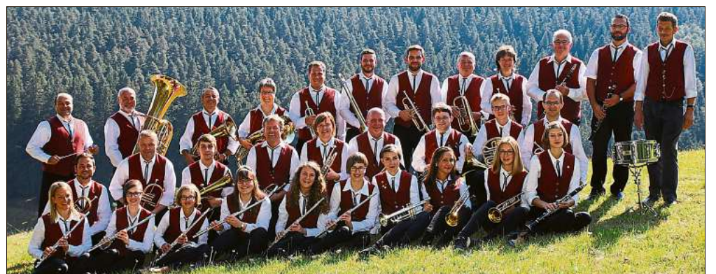
Das Trachtenblasorchester gibt diesen Monat zwei Kurkonzerte.

Zu den beiden Kurkonzerten laden das Trachtenblasorchester und die Baiersbronner Touristik alle Feriengäste und die einheimische Bevölkerung ein. Der Eintritt zu den beiden Konzerten ist frei.